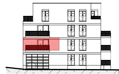
Gevelaanzicht - Blok A fase 3