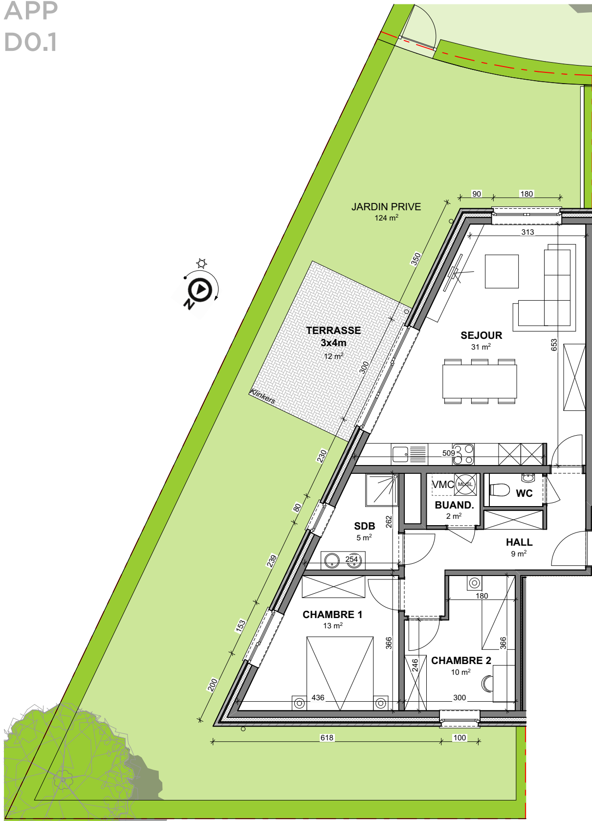
Vue en plan