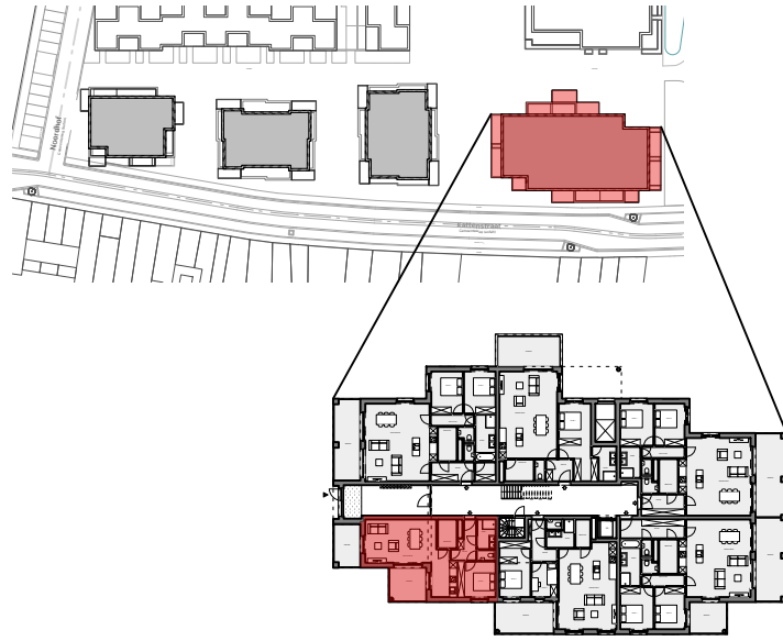
Inplantingsplan - Blok C fase 3