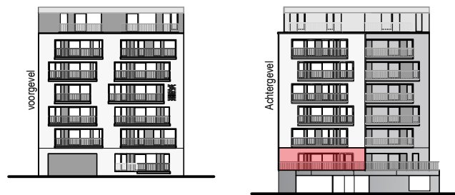
Gevelaanzicht Sand Dune