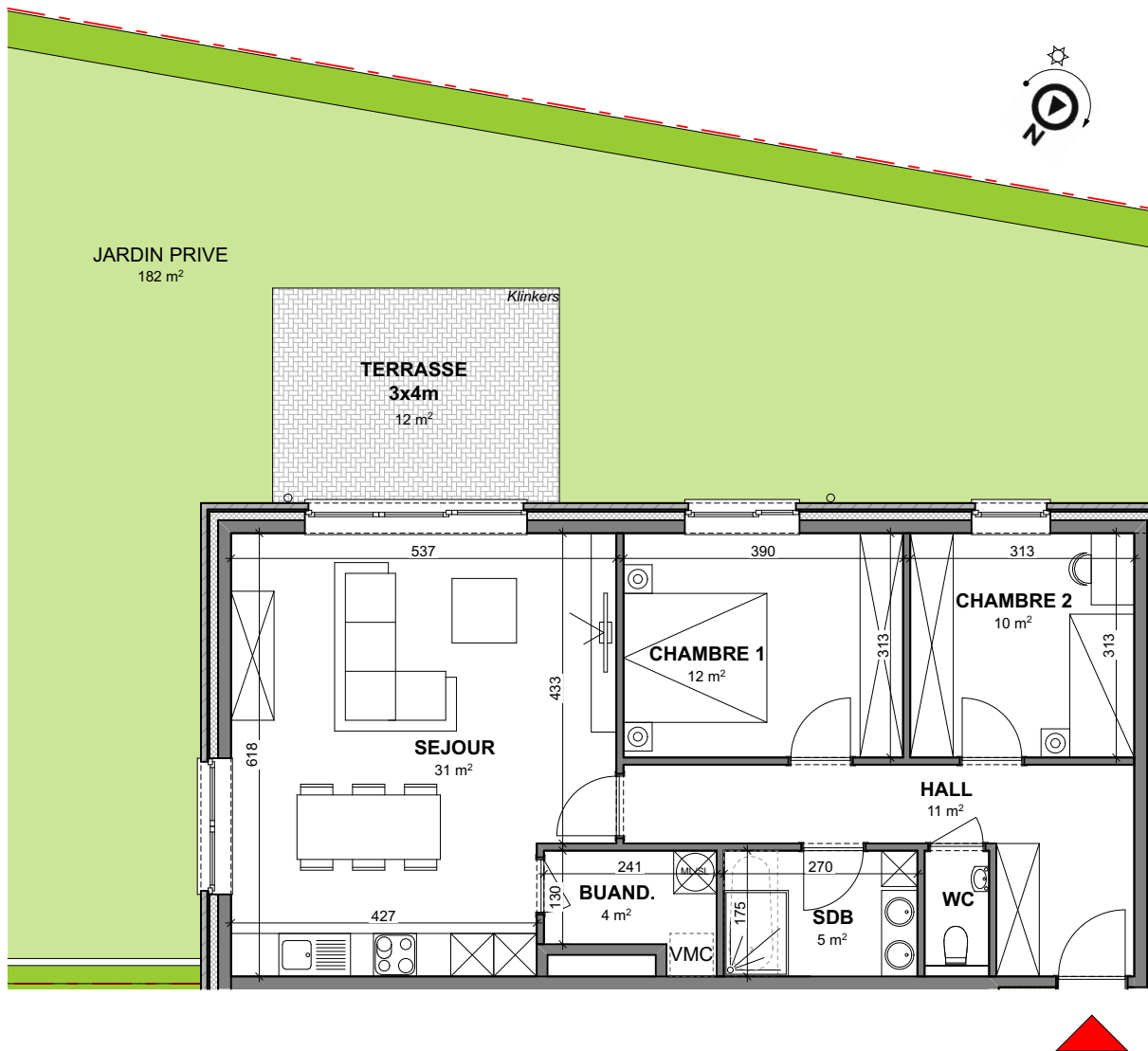
Vue en plan