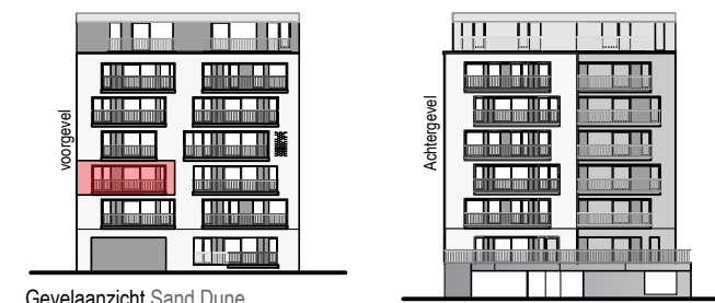
Gevelaanzicht Sand Dune