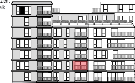
Gevelaanzicht Beach Walk