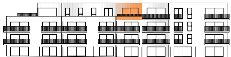
Gevel zuid- tuinzijde