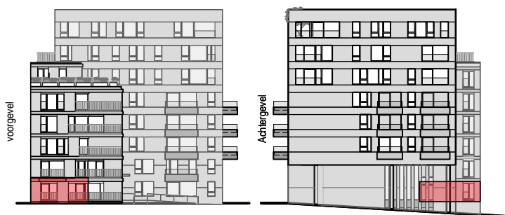
gevelaanzicht Sea Breeze