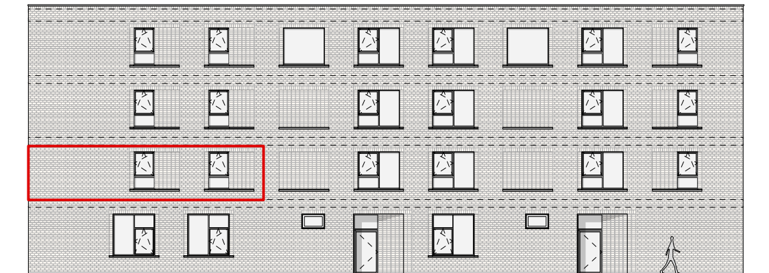
GEVEL - NOORD