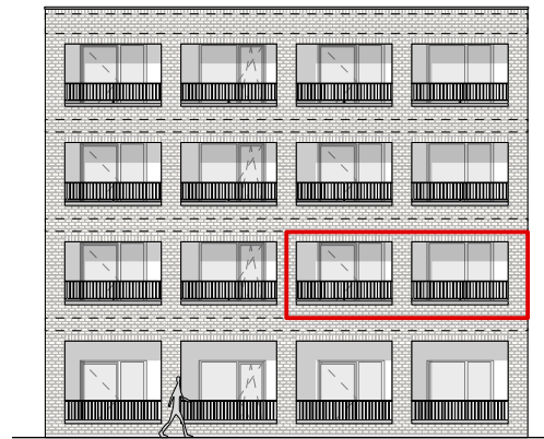
GEVEL - OOST